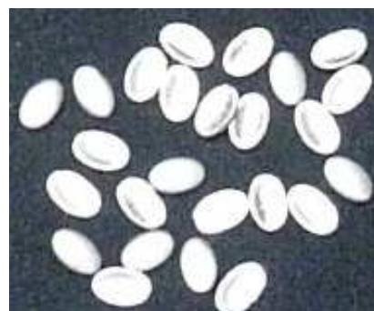
楕円下穴の打ち抜きスクラップ